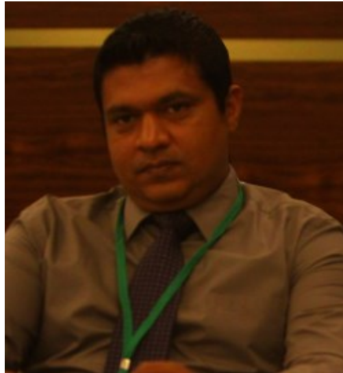
دُستور دُستور دُستور